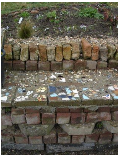
TorenTuin in Zaltbommel

Ze hebben van wilgentenen een soort afdak gemaakt om s "zomers in de schaduw te kunnen zitten Ook uit hun "omgangsregels" kunnen we misschien inspiratie op doen.