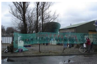
Spandoek open dag