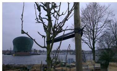
De laatste perenbomen vastgezet met een slinger tegen de verdachte stormvlagen

Marijke zoekt een mede tuingenoot ! Er is tevens nog 1 tuintje te vergeven ! Mensen kunnen zich aanmelden bij Joanne.