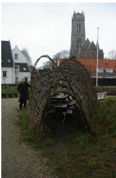
TorenTuin in Zaltbommel