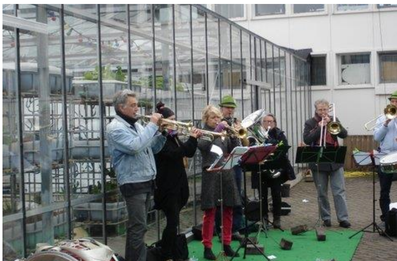
Een fotoverslag staat op pagina 6